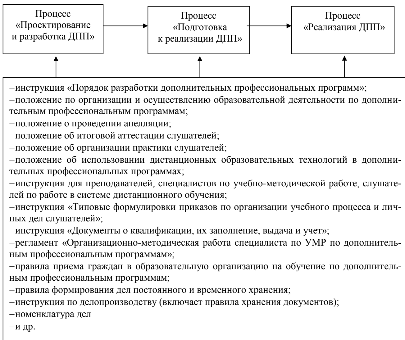
Рисунок 2 – Пример взаимосвязи документированных процедур процесса оказания образовательных услуг в сфере дополнительного профессионального образования.

На рисунке 2 приведен пример взаимосвязи документированных процедур процесса оказания образовательных услуг в сфере дополнительного профессионального образования и документов, описывающих последовательность выполнения их действий.