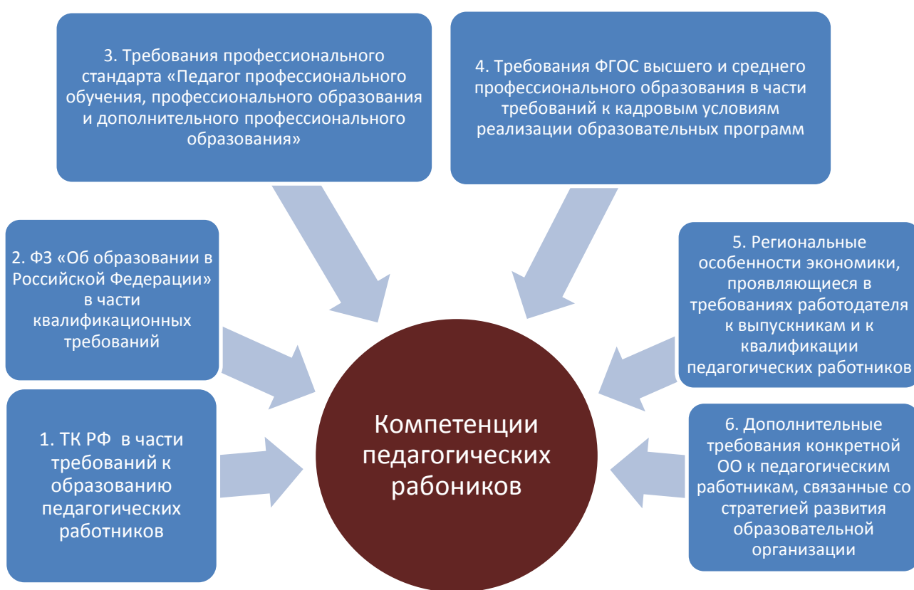
Рис. 1 – Требования к квалификации (компетенциям) педагогических работников

Общий перечень источников формирования требования к квалификации (компетенциям) педагогических работников представлен на рис. 1.