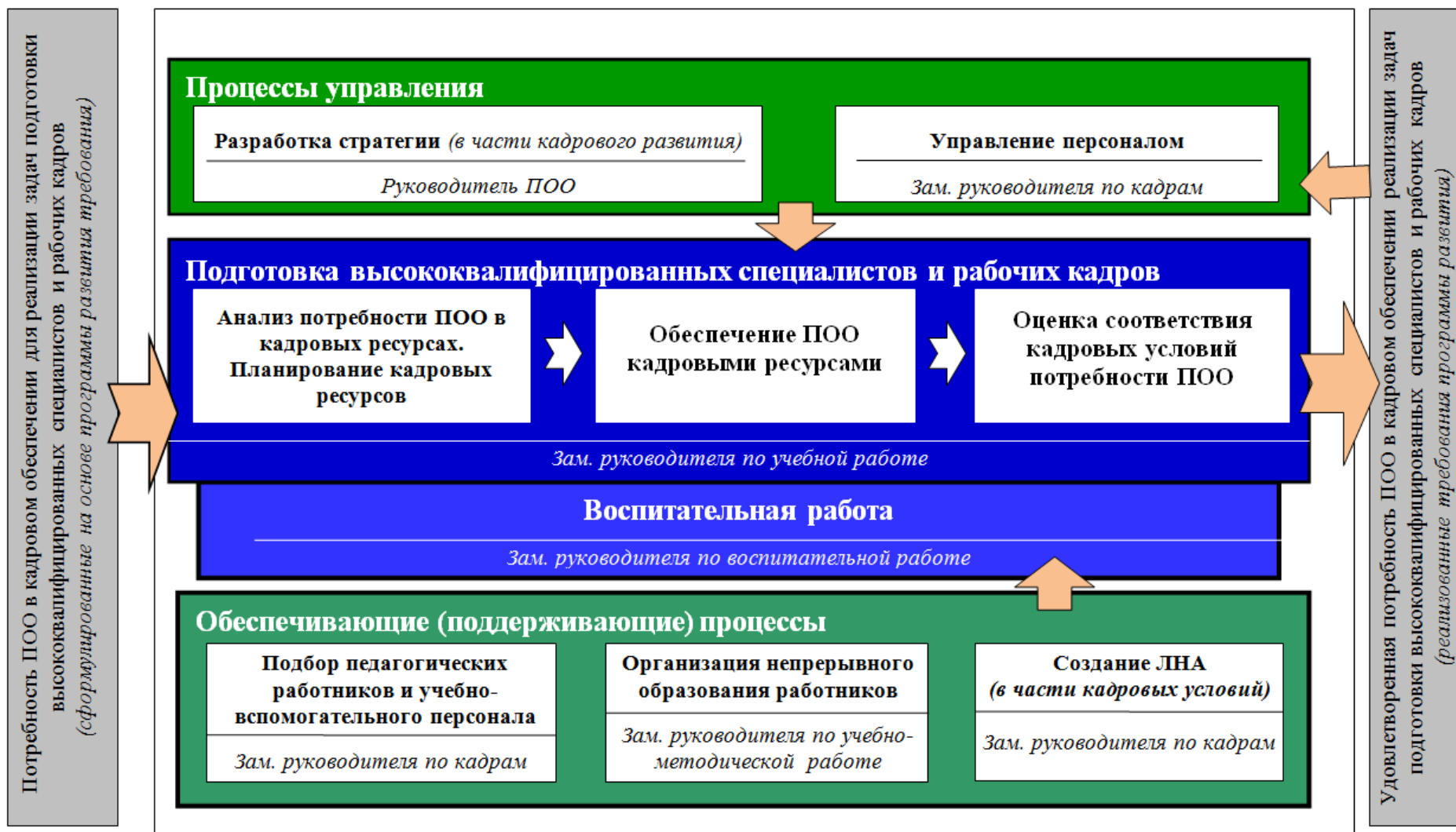
Рисунок 1 – Схема взаимодействия внутренних процессов и функциональная ответственность за формирование кадровых условий подготовки высококвалифицированных специалистов и рабочих кадров в ПОО